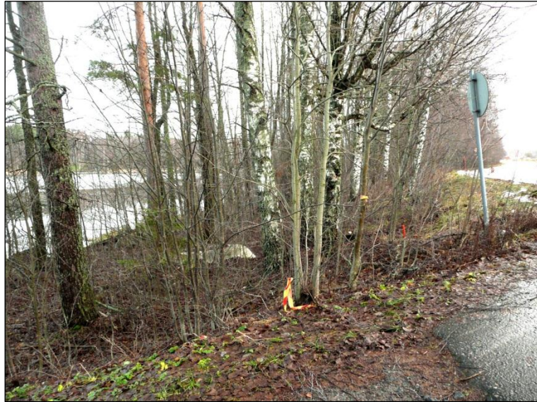
Rantaa ja vesijättöä Petäykseen menevän tien koillispuolella.