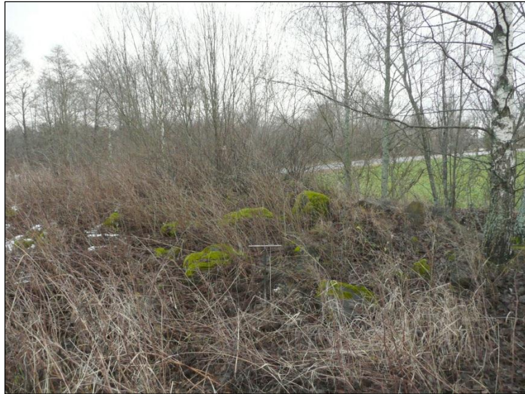
Raivauskivikasa Petäykseen menevän tien lounaispuolella. Kaava-alueen keskiosaa.