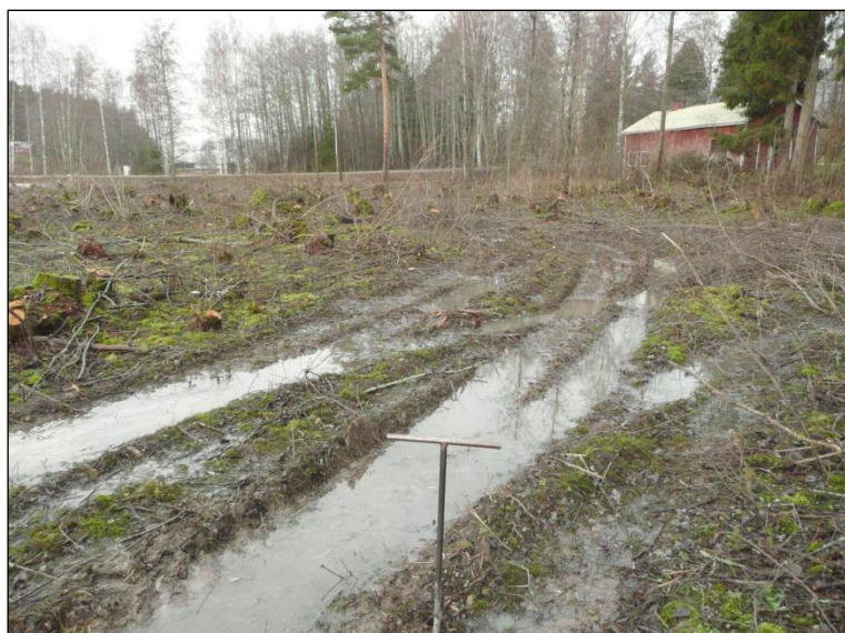
Hakattua savista vesijättöä Petäykseen menevän tien kaakkoispuolella..