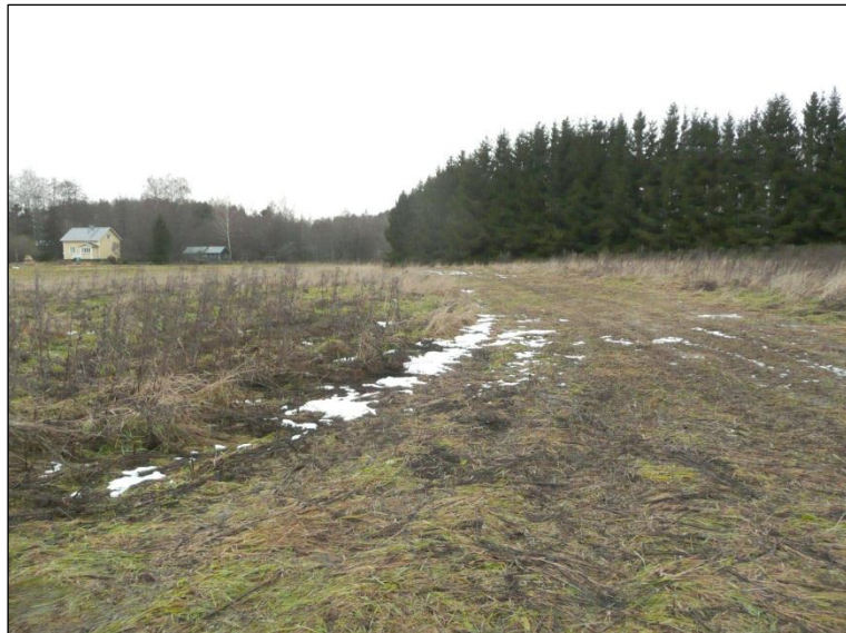
Kesannolla olevaa tasaista savipeltoa Petäykseen menevän tien lounaispuolella.