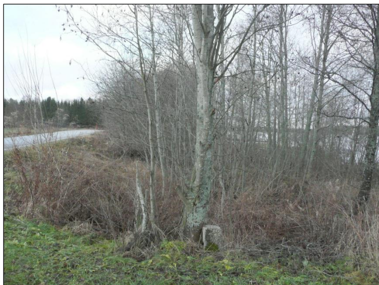
Vesijättöä Petäykseen menevän tien koillispuolella